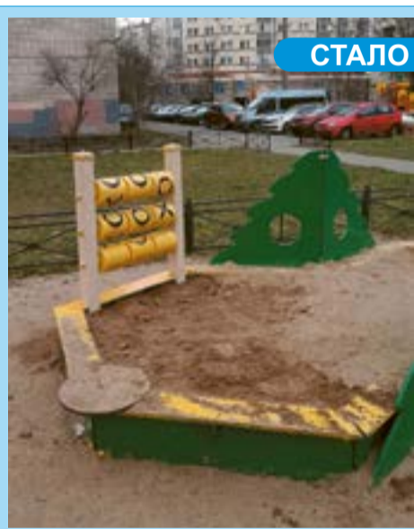
Ремонт игрового оборудования на детской площадке у дома 77 по бульвару Новаторов.