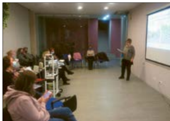
На снимке: презентация инициативы прошла успешно.