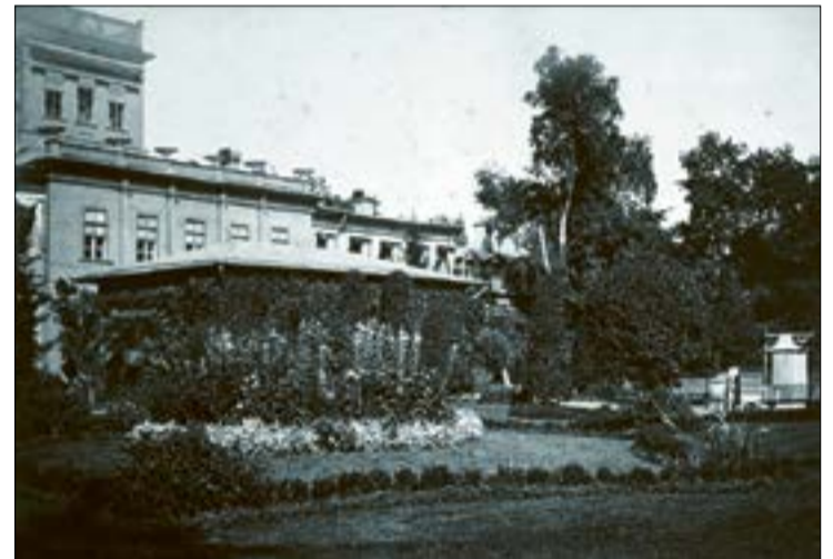
Главный дом в Ульянке, начало XX века, автор фотографии неизвестен.

Дом, по словам С. Д. Шереметева, не отличался изяществом, был длинным и имел мезонин и балкон, откуда открывался вид на залив. Через сад в дом вели березовая и липовая аллеи. Также в саду был пруд, а посреди него — остров, который славился обилием грибов. Внутри усадебного дома сохранилось немного предметов старины от прежних хозяев: несколько картин (женские портреты, пейзажи), стулья, диван, зеркало П. И. Жемчуговой и образ Неопалимой Купины. До 1860-х в усадьбе даже были оранжереи с фруктами. К моменту написания очерка (1893 год) в здесь еще хранилась мебель кабинета А. С. Шереметевой (матери автора) в «готическом вкусе» и столовые английские часы из красного дерева и бронзы.