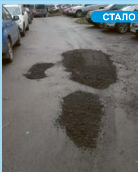
Временный ремонт асфальтобетонного покрытия дома по адресу Дачный пр., 17, корп. 4.

ряде участков асфальтобетонного покрытия по адресам: бульвар Новаторов, 77 и Дачный пр., 17, корп. 4.