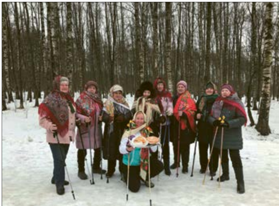
Участники Школы скандинавской ходьбы МО Дачное отметили Масленицу в парке Александрово.

Помните, что злокачественный процесс у ребенка — это не приговор! До 80 % долгосрочной ремиссии обеспечивают возможности современной медицины. Благотворительным фондом Культуры семьи и детства совместно с ГБУЗ «Санкт-Петербургский клинический научно-практический центр специализированных видов медицинской помощи (онкологический)» запущена горячая линия по вопросам детского рака. На линию могут позвонить родители, которым необходима консультация по подозрению на симптомы детского рака, а также по вопросам, возникающим в процессе его лечения. Горячая линия консультирует также врачей других специальностей. Телефон горячей линии: 8-800-222-29-87 (звонок по России бесплатный). Задать вопрос детскому онкологу можно с 10:00 до 16:00.