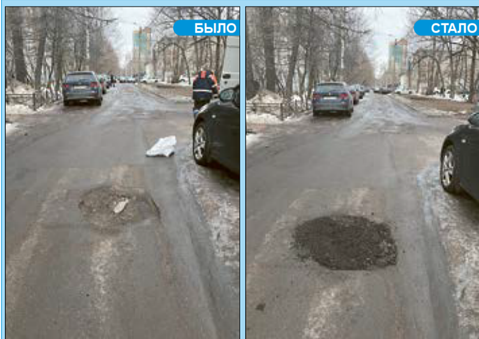
Ул. Танкиста Хрустицкого, 50

Еще раз уточним, что подсыпка — традиционная временная мера. Всеми такими ямами займется компания-подрядчик в ходе реализации программы благоустройства нашего муниципального образования.