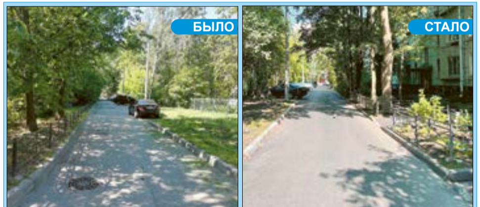
Ул. Лени Голикова, 68