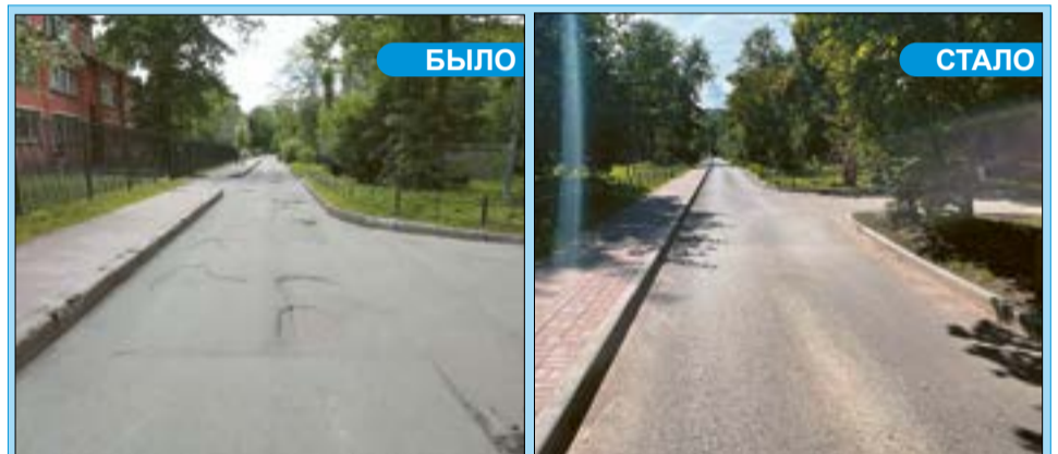
Трамвайный пр., 1

Снесено и отремонтировано более 80 аварийных деревьев на внутриквартальной территории по 30 адресам и более 90 аварийных деревьев на 21 территории зеленых насаждений общего пользования местного значения, на что потрачено около 1 800 тыс. руб. По заявкам граждан установлено 530 метров ограждений по 11 адресам. Скамьи, урны и вазоны размещены по семи адресам.