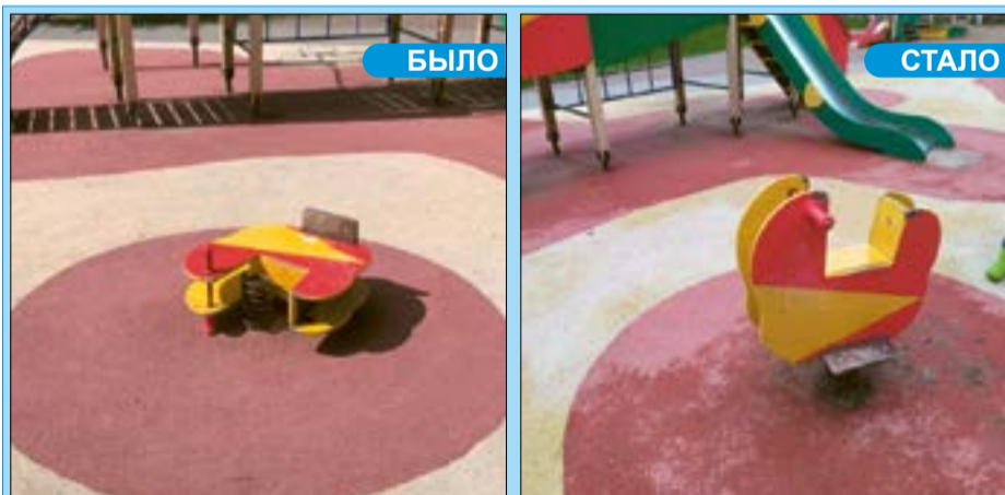
Ремонт игрового оборудования на детской площадке по адресу: Ленинский пр., 115, корп. 2

Сотрудники МСЗ за тот же период отремонтировали 22 единицы оборудования детских и спортивных площадок и уличной мебели. Работы проводились по адресам: пр. Ветеранов, 1, корп. 1, Дачный пр., 9, корп. 7, 19, корп. 2 и корп. 3, 21, корп. 1, Ленинский пр., 115, корп. 2, ул. Лени Голикова, 15, корп. 4, 31, корп. 3, 43, 49, 86; ул. Танкиста Хрустицкого, 114.