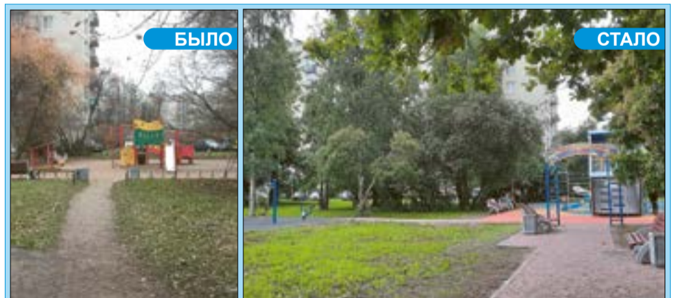
Ул. Лени Голикова, 4