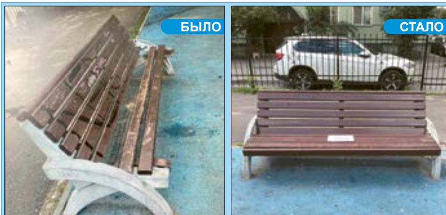
Ремонт и окраска скамейки у дома 49 по ул. Лени Голикова