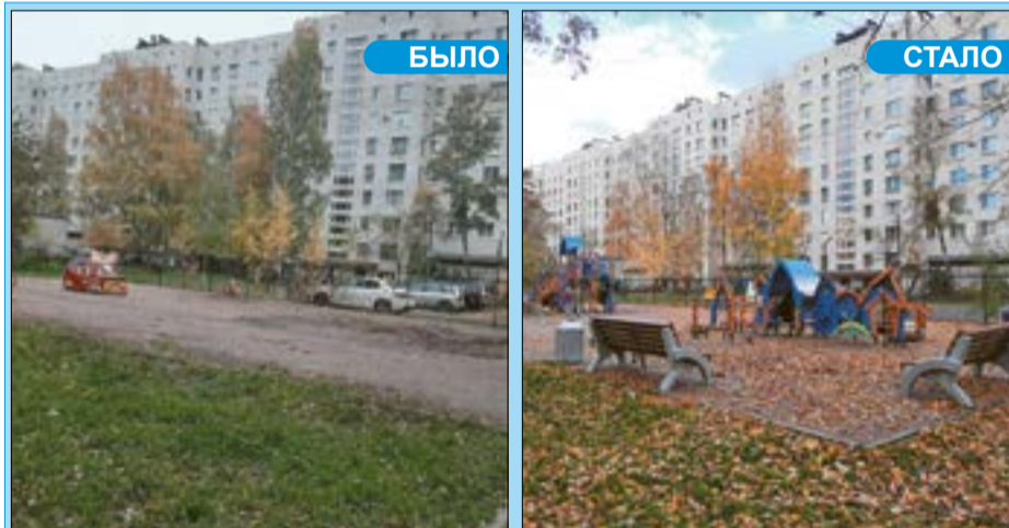
Обновленная детская площадка по адресу ул. Лени Голикова, 51.

Уважаемые жители МО Дачное! 30 октября 2021 года, в Санкт-Петербурге будет проводиться традиционный осенний субботник. Приглашаем всех помочь в подготовке нашего любимого города к зиме.